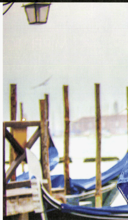
In apertura, tre simboli di Venezia: una tipica maschera, le gondole e, in lontananza, il campanile di San Marco. Sotto, scatti delle passate edizioni del Ballo del Doge

sica e teatro". Il poster, immagine ufficiale della manifestazione, è opera dell'artista Eduardo Guelfenbein che con la tecnica del cut out ha unito ritagli delle sue opere pittoriche recenti: «mi diverto a fare collages e giocare con le forbici – dice Eduardo – e il carnevale si presta benissimo a questa esplosione di colori».